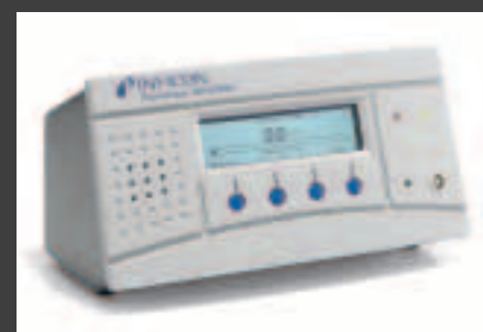
多用途でフレキシブルな卓上型

Sensistor ISH2000は様々なテスト環境において迅速なリーク検知が可能なAC電源駆動の卓上型モデルです。(P50ハンドプローブ・ケーブル付属)