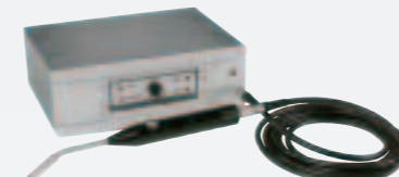
AP55 スニファープローブ プローブ先端が届きにくい場所でも迅速にリーク位置の特定が可能