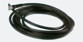
C21 プローブケーブル 様々な検査環境に合わせ、3m、6m、9mのケーブルを用意