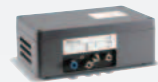
AP29ECO サンプリングプローブ テストワーク全体の自動リーク検査に最適

ISH2000シリーズと豊富なオプション機器を組み合わせる事により、様々なアプリケーションへの対応が可能となります。