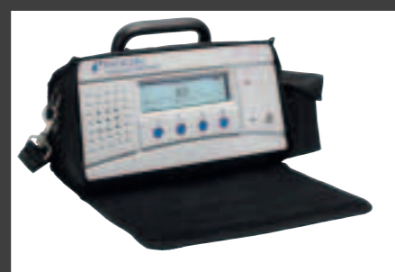
ラフな環境にも使用可能なバッテリー駆動型

Sensistor ISH2000Pは卓上型と同じ機能を持ちながら、自動・半自動検査システムへの組込に適したパネルマウント型モデルです。(プローブ・ケーブル別途手配)