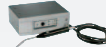
AP57 カウンターフロープローブ トレーサガスのバックグラウンドが高い環境下でエアカーテンによる保護気流を供給