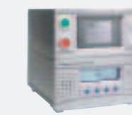
Sensistor ILS500 リーク検査システム 先進の制御性能を備えた自動検査システム