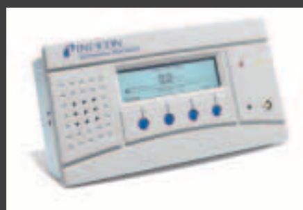
自動検査システムに最適なパネルマウント型

Sensistor ISH2000は様々なテスト環境において迅速なリーク検知が可能なAC電源駆動の卓上型モデルです。(P50ハンドプローブ・ケーブル付属)