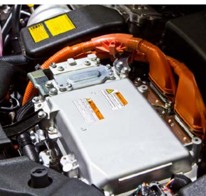
电动汽车内的电池组需进行泄漏测试，以防止冷却液体泄漏和水渗透进来。